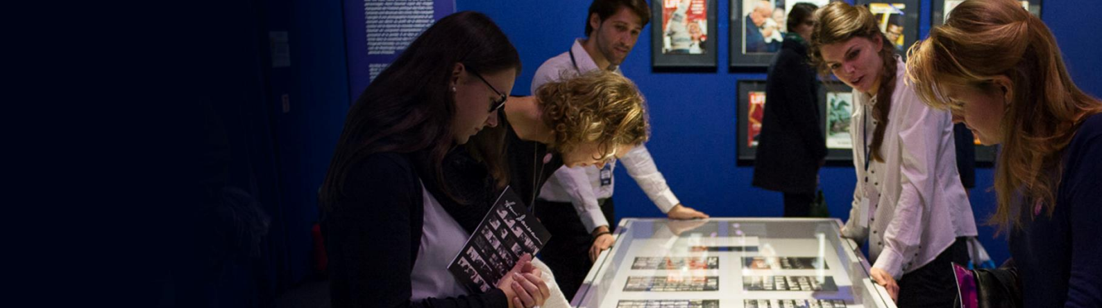
Exposition Manhattan Darkroom au Palais d'Iéna