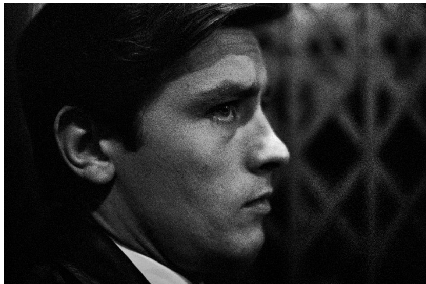
Alain Delon, 1960.