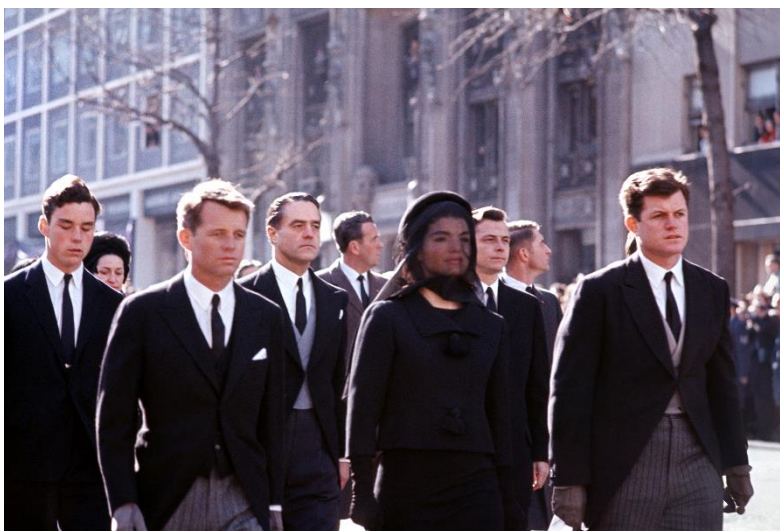
25 novembre 1963 Funérailles de JFK. Photographie reprise par Andy Warhol et ses séries historiques « Jackies »