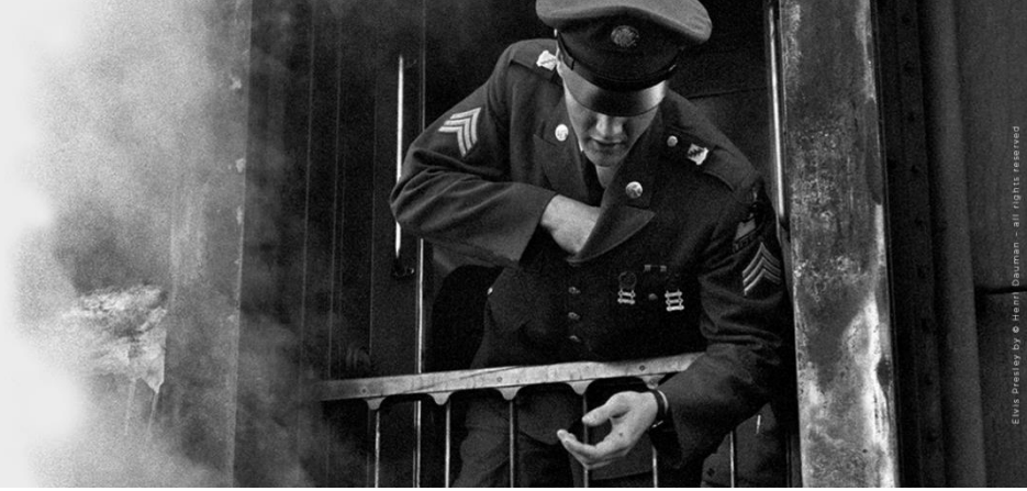
Elvis Presley return to Graceland(détail), 1960