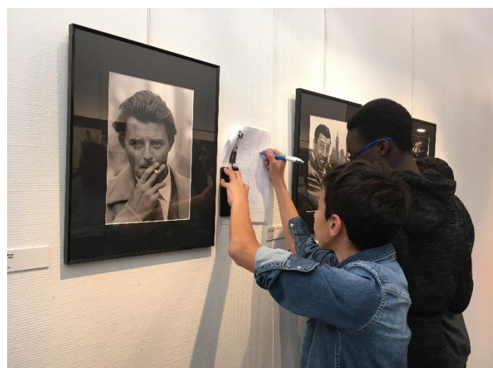
Exposition Manhattan Darkroom à Courbevoie

Les œuvres de cette exposition éclectique sont uniques et originales. Elles étonnent et interpellent le visiteur. Les supports filmiques éclairent le spectateur et replacent les œuvres dans leur contexte..