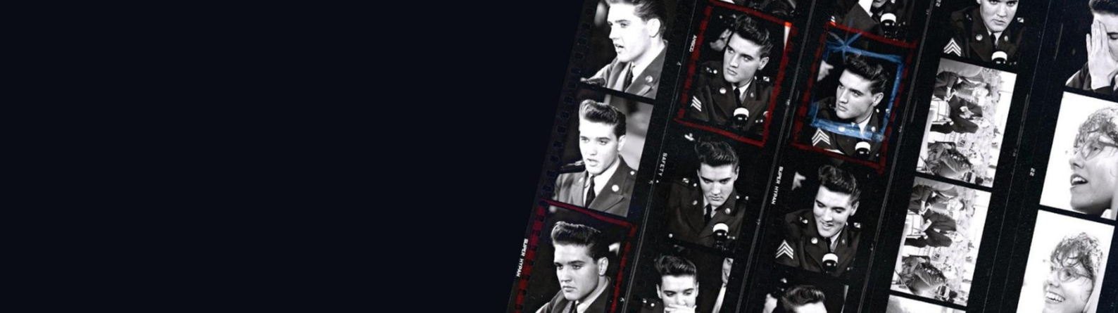
Planche contact Elvis Presley - 1960